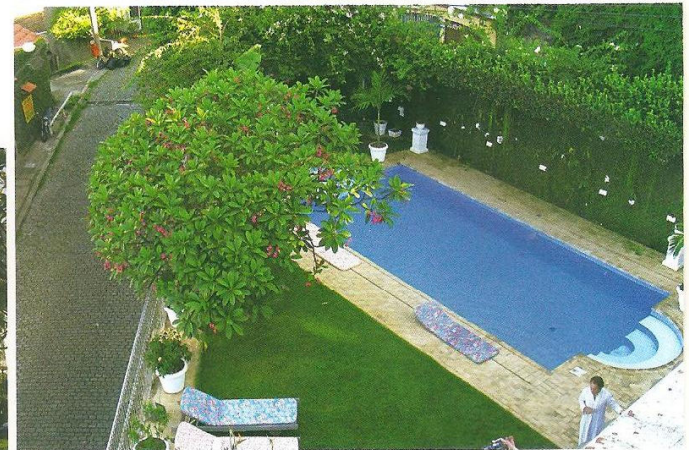
À esquerda, fachada do exclusivo hotel. Acima, quarto e piscina atraem hóspedes internacionais. Abaixo, café da manhã emoldurado pela bela paisagem carioca.